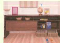
⑤ただいまカウンター