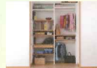
③ただいまクローゼット