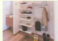
①ただいまクローク